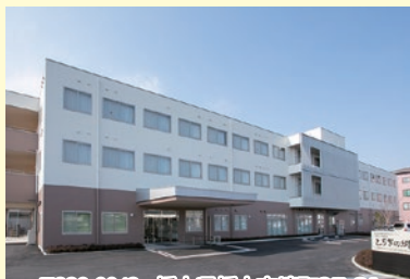
〒328-0043 栃木県栃木市境町27-21