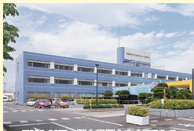
〒328-0071 栃木県栃木市大町39-5