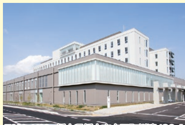
〒329-4498 栃木県栃木市大平町川連420-1