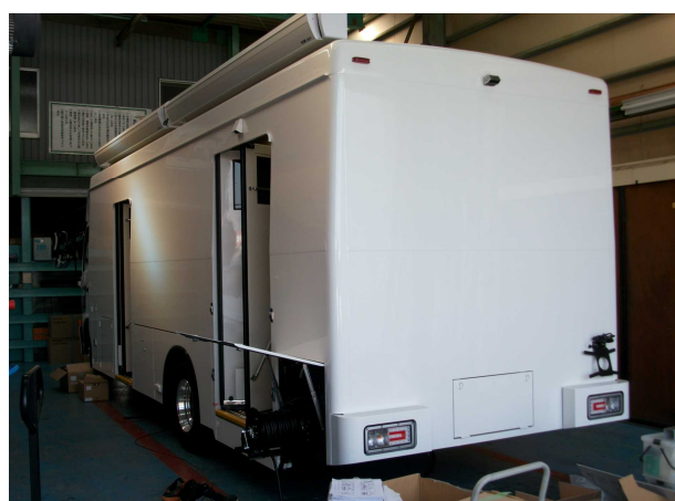
胸部デジタル検診車（後方斜め）

この検診車は、トラックに架装を施し外観をバスの形状として製作しました。搭載した装置の特徴としては、最新のデジタルX線装置（FPD CsI)にしたことで、胸部レントゲン撮影を今までよりも低線量で撮影することで人体への影響を少なくしております。また、撮影台についても大林製作所が開発したX線装置と連動型で他にはない第1号機を導入。今まで不可能だったイスに座ったまま後前方向の撮影をする事が可能となりました。