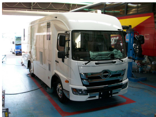
胸部デジタル検診車（前方斜め）

この検診車は、トラックに架装を施し外観をバスの形状として製作しました。搭載した装置の特徴としては、最新のデジタルX線装置（FPD CsI)にしたことで、胸部レントゲン撮影を今までよりも低線量で撮影することで人体への影響を少なくしております。また、撮影台についても大林製作所が開発したX線装置と連動型で他にはない第1号機を導入。今まで不可能だったイスに座ったまま後前方向の撮影をする事が可能となりました。