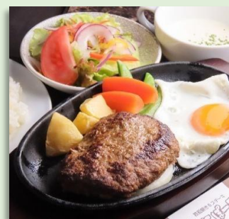
ハンバーグランチ