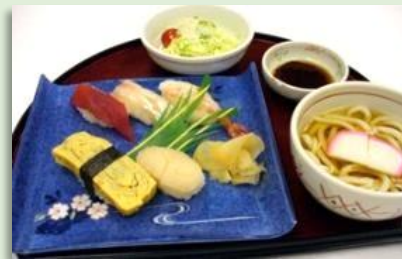
寿司と小うどんセット