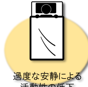
過度な安静による 活動性の低下 (廃用症候群)